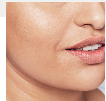
Detailansicht des Gesichts nach der Behandlung