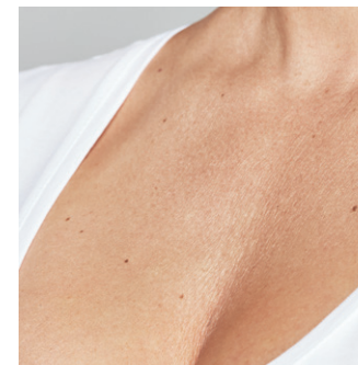
Detailansicht des Dekolletés vor der Behandlung