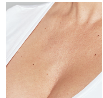
Detailansicht des Dekolletés nach der Behandlung