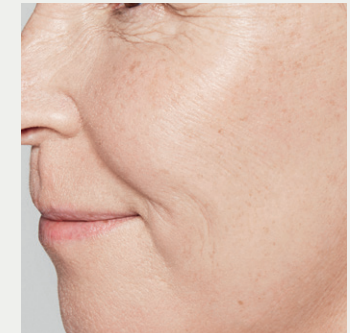
Detailansicht des Gesichts nach der Behandlung