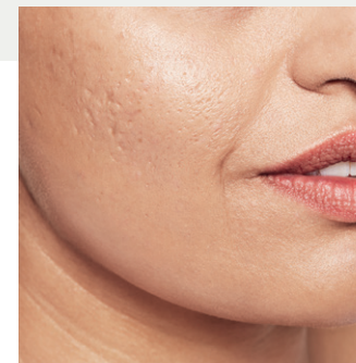
Detailansicht des Gesichts vor der Behandlung