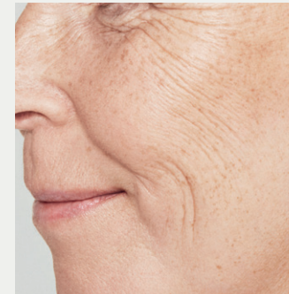
Detailansicht des Gesichts vor der Behandlung